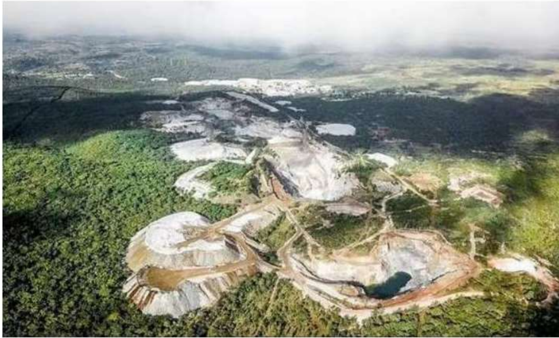
[그림] 짐바브웨 리튬 광산 장면(거의 노천에서 채굴)

(4) 현재 월 생산량 1천톤으로 중국 수출중 (사업성 검증됨, 톤당 $1200)